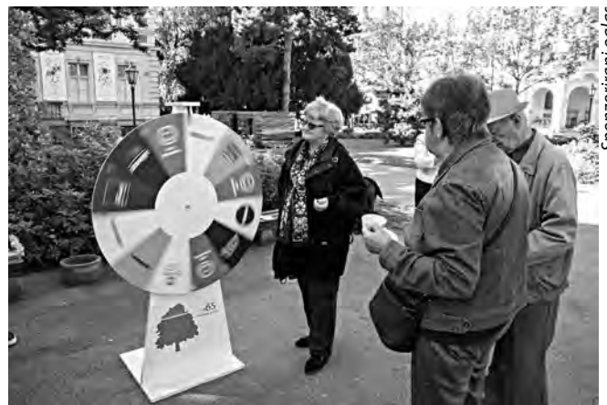
Kolo sreće u sklopu promocije Najmudriji.hr

Smanjiti usamljenost kontaktima s obitelji, prijateljima, ali i s ostalim korisnicima digitalnih platformi jedna je od misija ovog projekta.