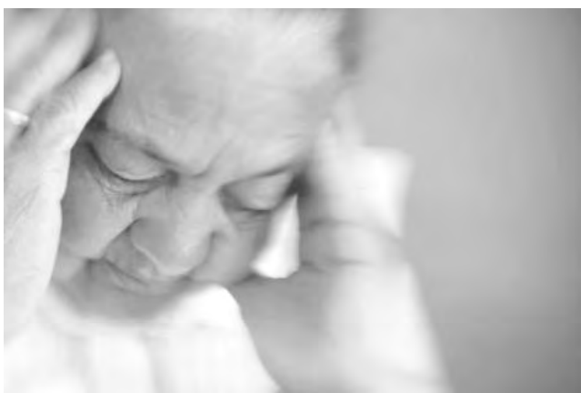
Piše: Biserka Budigam, psihologinja

Tu su i predsjednički izbori, a krajem godine i parlamentarni izbori. A nama preostaje biti strpljivi i nadati se boljim vremenima! Ako budemo sve bolje silno i žarko željeli moglo bi nam se to jednoga dana i ostvariti, ako ne i prije!