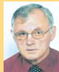
Odgovara: Milan Tomičić dipl. pravnik

Odgovor: Bez obzira na to što Vaša druga supruga nije vlasnica obiteljske kuće koja je predmet ugovora o doživotnom uzdržavanju, možete ju navesti kao jednog od primatelja uzdržavanja. To znači da, ako Vi umrete prije nje, Vaš sin, kao davatelj uzdržavanja, dužan je uzdržavati Vašu suprugu sve do njezine smrti. Opreza radi, potrebno je tu odredbu uvrstiti u ugovor, a Vaš sin, kao Vaš krvni srodnik u prvoj liniji, neće biti obveznik plaćanja poreza na promet nekretnina.