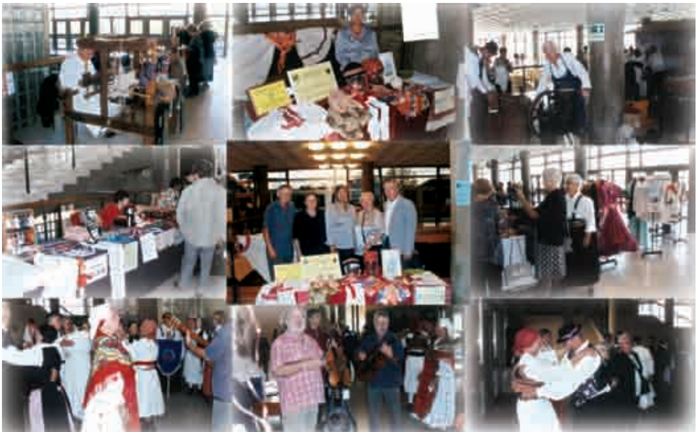
Sudionici prvog festivala Zlatna dob; više na str. 11. Tekst prof. Biserke Budigam, fotografije iz fototeke Povjerenišva SUH-a za grad Zagreb.

Netko (pisano velikim slovom) koji je, umjesto isplate božićnice, mjesec-dva prije početka svetkovanja Božića i Nove godine odnosno nailaska zime (koja doduše ne mora biti uvijek »ljuta«), objavio narodu HEP-ovu ni malo utješnu odluku o sk- Nastavak na 2. str. →