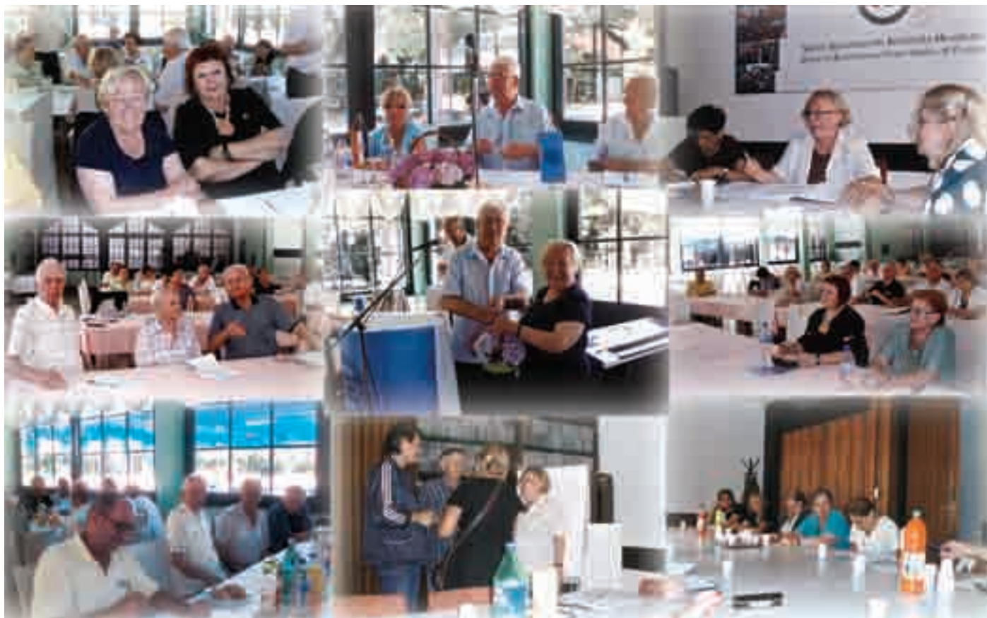
Nakon održanih izbornih skupština u SUH-ovim podružnicama te županijskim povjereništvima i u Povjereništvu SUH-a za grad Zagreb, slijedio je izbor novog vodstva. Na slici: Sudionici izborne konferencije u Povjereništvu SUH-a za grad Zagreb. Više o izborima na str. 8. i 9.