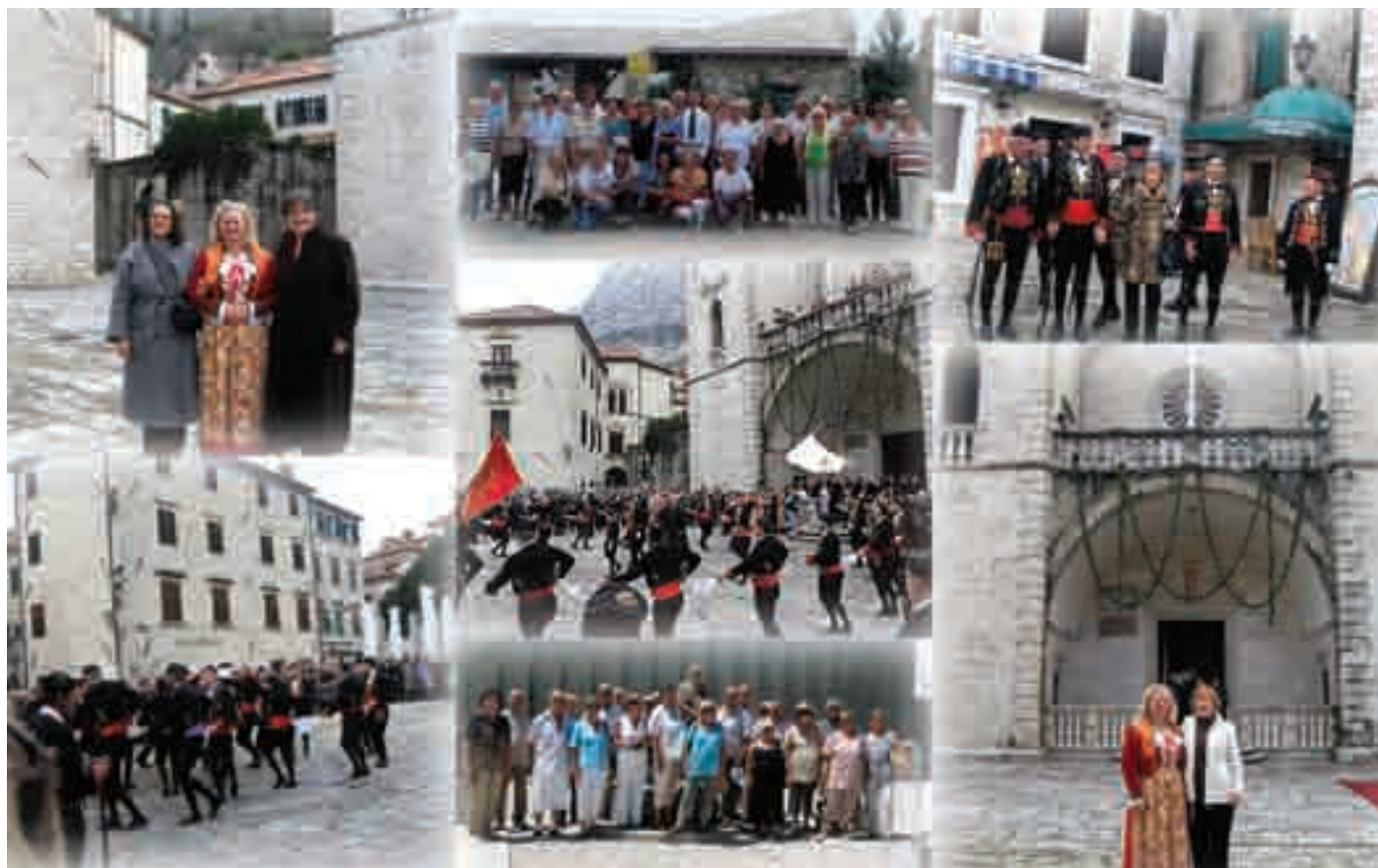
Umirovljenice i umirovljenici dubrovačke Podružnice Sindikata umirovljenika Hrvatske pohodili Kotor i Tivat te nazočili Festi sv. Tripuna (više na 3. str.)