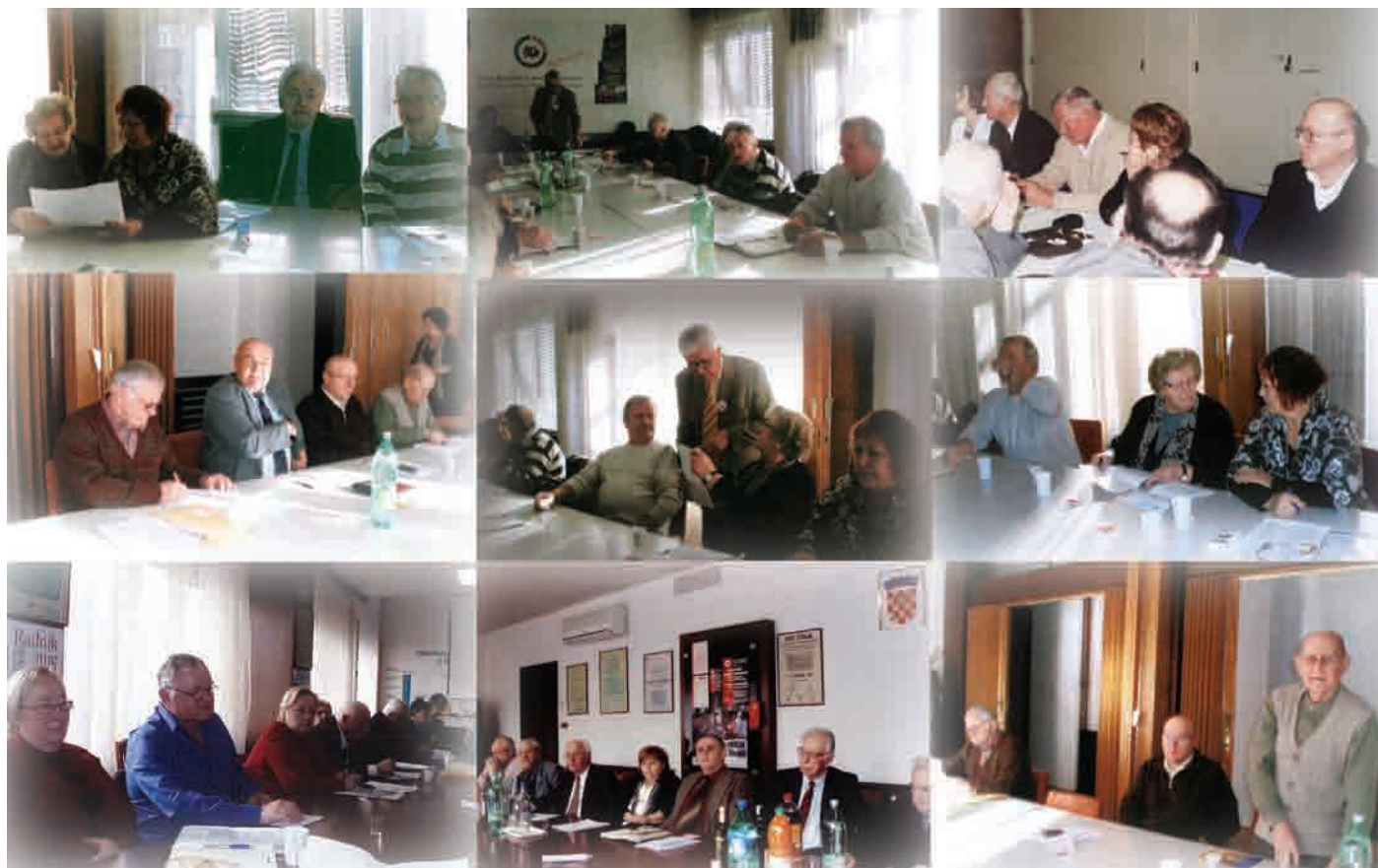
Na sjednici Predsjedništva Glavnog odbora SUH-a i drugim SUH-ovim radnim tijelima (više na 15. str.)

koje su njihovi vlasnici aktivirali na jedan dan pa ih »zamrznuli« (poput promućurnoga g. Vladimira Šeksa koji je tako postupio iz »preventivnih« razloga) i novoostvarenih povlaštenih, također »zamrznutih«, mirovina u zadnji trenutak (poput one g. Damira Kajina, najučestalijeg saborskog govornika koji od Nastavak na 2. str. →