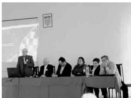
Okrugli stol u Puli — kampanja za pristupanje u EU