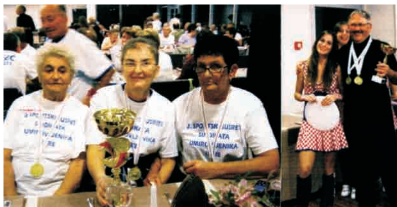
»Treća mladost« istarskih članica i članova SUHV-a na održanim sportskim susretima (više na 14. str.)

Tko prekora opakoga, prima ljagu. Ne kori podsmjevača da te ne zamrzi; kori mudra da te zavoli. Pouči mudroga, i bit će još mudriji; uputi pravednoga, i uvećat će se njegovo znanje.