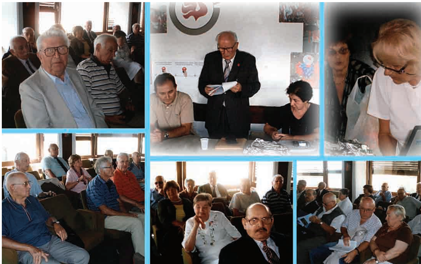
U povodu Međunarodnog dana stariih osoba i Dana SUH-a, 1. listopada, Sindikat umirovljenika Hrvatske svečanom sjednicom Predsjedništva Glavnog odbora s uzvanicima održaoj 4. listopada 2011. godine obilježio je 19. obljetnicu osnutka i djelovanja, snimio: Matija Voščun (više o tome na str. 3. i 12.)