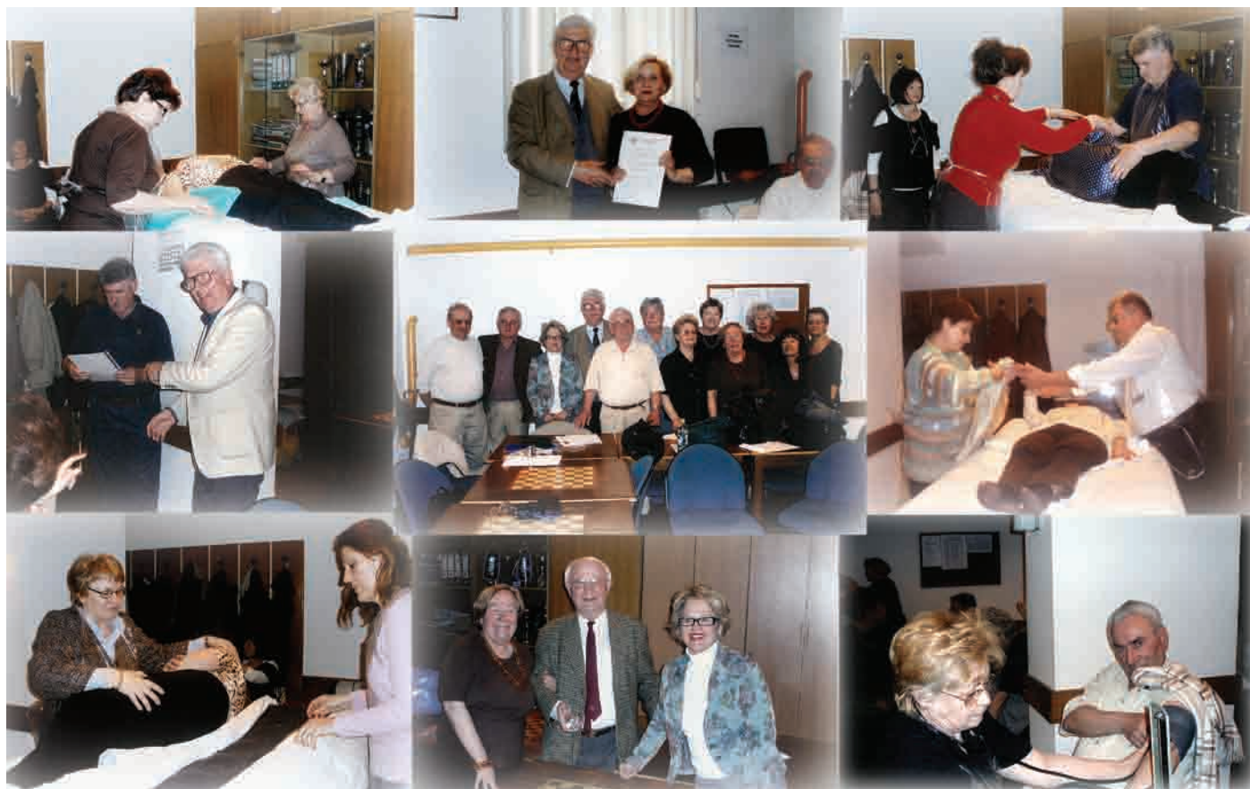
Članice i članovi Sindikata umirovljenika Hrvatske na tečaju za volontere u programu Njega bolesnika i pomoć u kući održanom u organizaciji Povjereništva SUH-a grada Zagreba, Podružnice INA, u proljeću 2011. godine