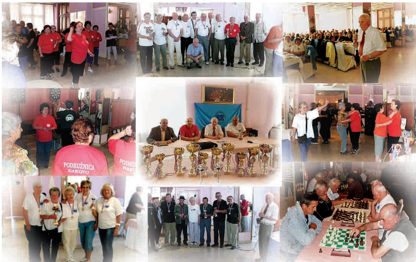
Sportsko-rekreativni susreti članova SUH-a Slavonsko-baranjske županije održani u Đakovu 19. lipnja 2011., više na 3. str.

Mnogi su od njih duže vrijeme nezaposleni, a neki rade a ne dobivaju plaću ili su bili prisiljeni otići u mirovinu po penalizirajućim odredbama Zakona o mirovinskom osiguranju te sada dobivaju mirovinska Nastavak na 2. str. →