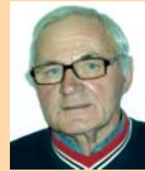
Odgovara: Milan Tomičić dipl. pravnik

Odgovor: Prema odredbi članka 581. Zakona o odnosima davatelj uzdržavanja, kada je predmet ugovora o doživotnom uzdržavanju nekretnina, ovlašten je zatražiti zabilježbu ugovora u zemljišne knjige. Time je javno obznanjeno postojanje ugovora o doživotnom uzdržavanju i da će davatelj uzdržavanja nakon smrti primatelja uzdržavanja steći vlasništvo nad nekretninom. Zabilježbom ugovora davatelj uzdržavanja ima prednost pred novim davateljima uzdržavanja koji su ugovor potpisali nakon upisa zabilježbe. Stoga možete biti vrlo zahvalni svojoj prijateljici koja Vas je pravovremeno upozorila na potrebu zabilježbe ugovora u zemljišne knjige.