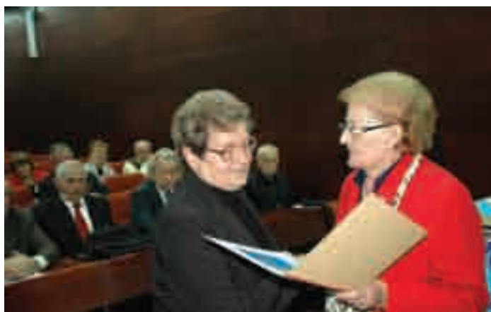
Članovi Glavnog odbora SUH-a na sjednici nakon provedenih izbora i usvajanja programskih dokumenata te razdiobe dužnosti (više na 2.str.)